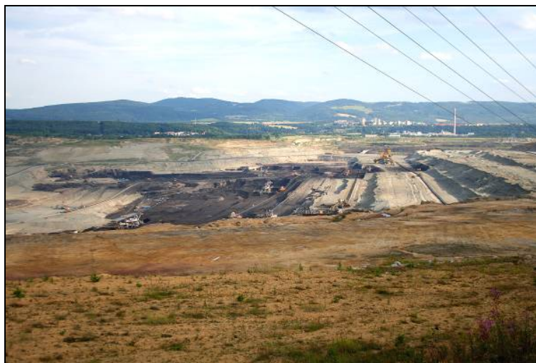
Pohled z Prezidentské vyhlídky na současnou sokolovskou pánev krajinu