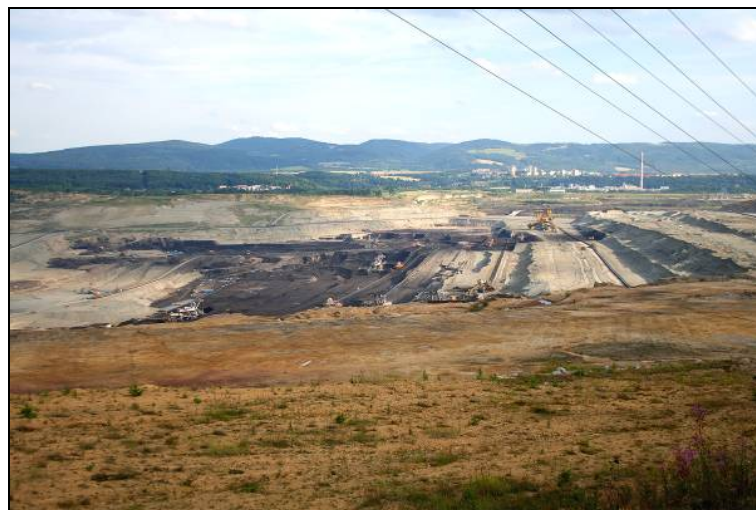
Pohled z Prezidentské vyhlídky na současnou sokolovskou pánev krajinu