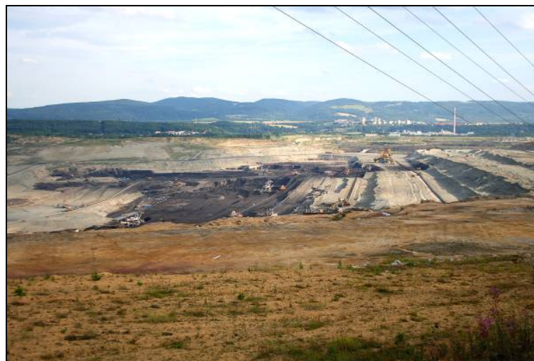
Pohled z Prezidentské vyhlídky na současnou sokolovskou pánev krajinu